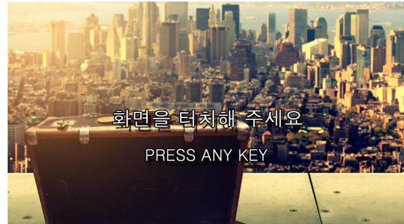
‘돈을 드립니다!!!’ 게임 시작 대기화면 도안