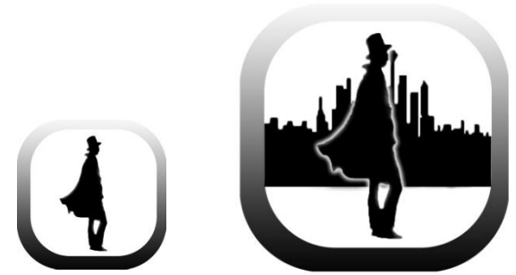
‘돈을 드립니다!!!’ 게임 실행 아이콘 도안